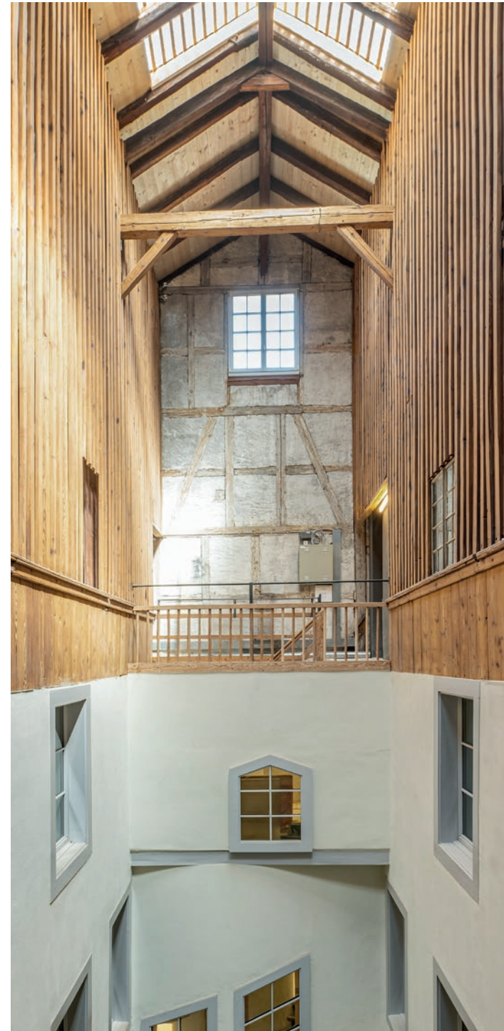
35–37 Sanierung Wohn- und Geschäftshaus, Thun, BE 2020–2023 In Zusammenarbeit mit der Denkmalpflege des Kantons Bern